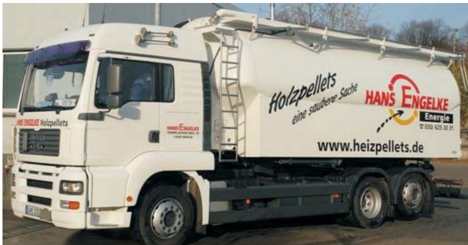
Das ist er: Der neue, zweite Pellets-Tankwagen von ENGELKE. Damit können wir 13 t Pellets auf einen Rutsch ausliefern.

● Richtig, was immer Sie in nächster Zeit in Sachen Heizung machen werden, es kostet Geld. Aber es spart natürlich auch Geld, denn Energie wird nicht billiger. Darum ist eine Finanzierung der eigenen Pläne oft sinnvoll. Wie das am besten geht, erfahren Sie auf dem Info-Stand der Postbank.