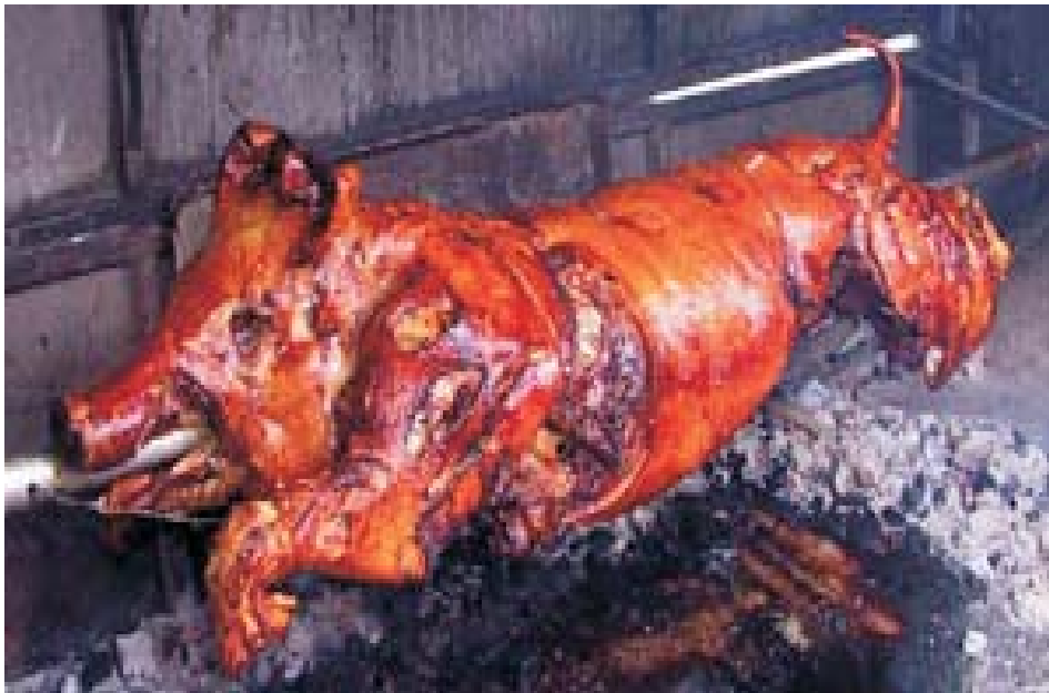
Spanferkel auf dem Grill: Wenn „Obelixe“ zu Besuch kommen . . .