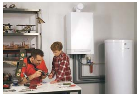
Öl-Brennwertheizung mit Warmwasserspeicher

In Zeiten rapide steigender Energiepreise kann man sich einer solchen Ersparnis nicht mehr verschließen.