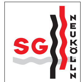
Vereinseblem der SG Neukölln

Ein kurzer, indes keineswegs vollständiger Überblick über das Angebot der Schwimm-Gemeinschaft Neukölln ist vielleicht das überzeugendste Argument, ihr beizutreten.