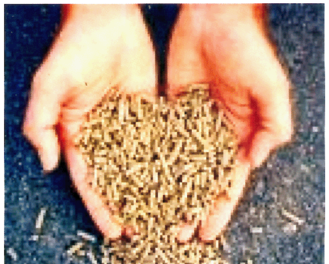
Pellets: Ökonomisch und ökologisch inzwischen absolut „in“

Wir von ENGELKE sind Spezialisten für Pellets-Heizungen und beantworten Ihnen gerne jede weitere Frage zu dieser Technik, die in Deutschland eine rasante Entwicklung nimmt.