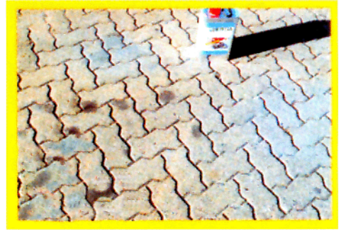
1. BENTIA auf den Fleck pinseln!