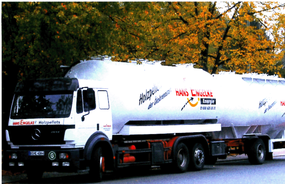
Engelke-Silowagen für die Versorgung mit dem alternativen Brennstoff Holzpellets