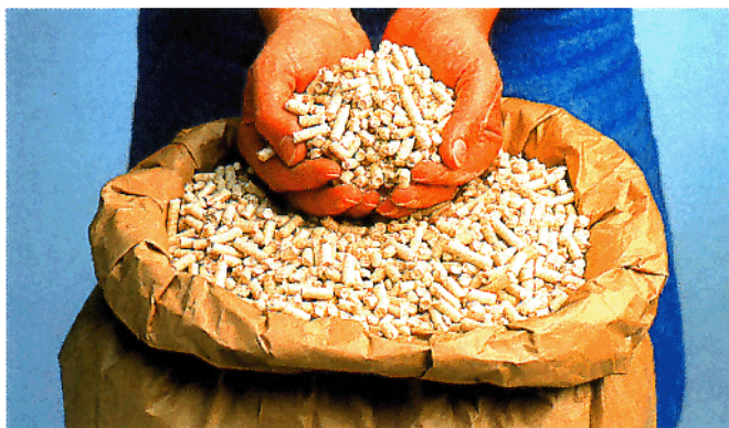
Pellets, hier aus dem Sack: Umweltfreundlich ohne Ende.

Sie sind als Brennstoff stark im Kommen: Pellets – 10 bis 25 mm lange, aus sonst kaum noch verwertbarem Abfallholz gepreßte Stäbchen. Pellets gehören seit einiger Zeit zu unserem Sortiment, und wir stellten das junge Produkt schon einmal in „ENGELKE aktuell“ vor. Diese Pellets verkauften wir bisher ausschließlich in Papiersäcken. Jetzt liefern wir sie auch als Siloware an. Als Siloware?