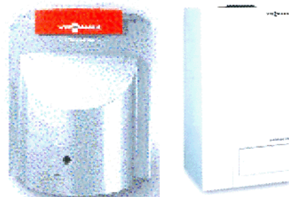
Stehender und hängender Brennwertkessel von Viessmann (Vitolaplus 300, Vitoplus 300)

Dann und dort können Sie die Brennwertkessel von Viessmann – einer davon zum „an die Wand hängen“ – persönlich in Augenschein nehmen (siehe auch Fotos).