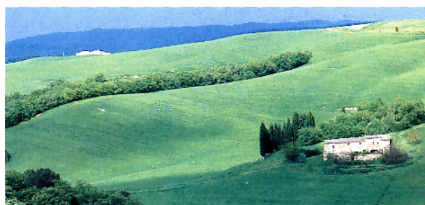
Die zauberhafte Landschaft der Toskana: Dolce far niente.

Die Fragen machen keine Schwierigkeiten, denn wie alt etwa Kessel und Brenner sind, geht aus deren Typenschildern hervor, ob Ihr Tank im Vorgarten eingebuddelt ist oder im Keller steht,