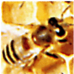
Biene „Petra“: Arbeitet für ENGELKE.