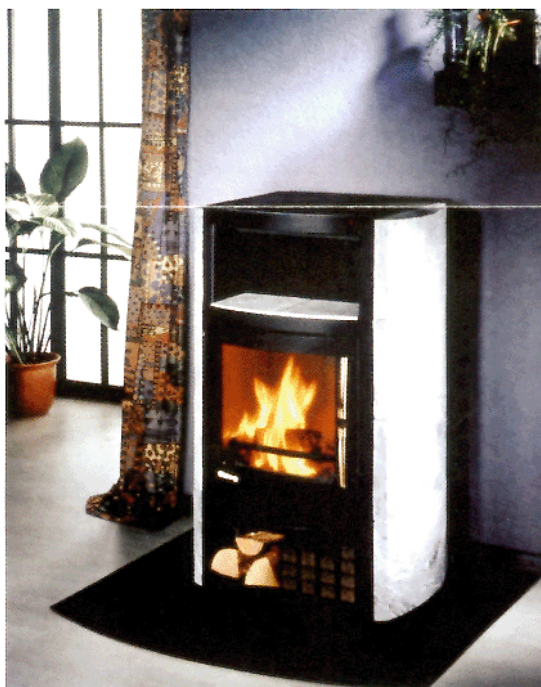
Moderner Kaminofen: Ein Schau-Stück

Einen wirklich guten Kaminofen (für den man keineswegs 10.000 Mark hinblättern muß) hat man vor sich, wenn