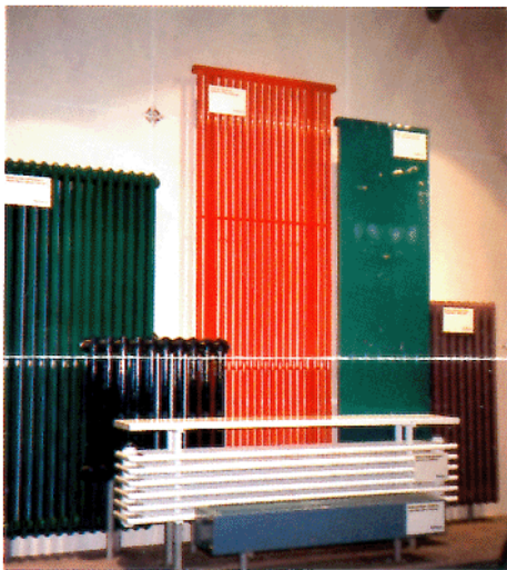
Heizkörper als Sitzbank und Raumteiler