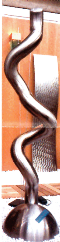
Heizkörper als Evas Schlange

Heizkörper müssen nicht so aussehen, wie sie aussehen. Es geht auch anders, wie die Fotos hier zeigen. Sie können einen zusätzlichen Nutzen haben, sie können Kunst sein. Oder wenigstens bunt.