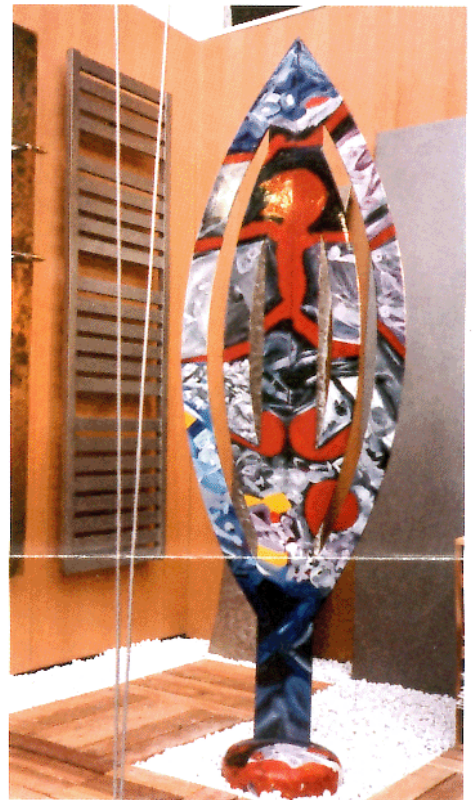
Heizkörper, dem Schild eines afrikanischen Kriegers nachempfunden

Hersteller solcher Heizkörper sind Runaco, Buderus und andere.