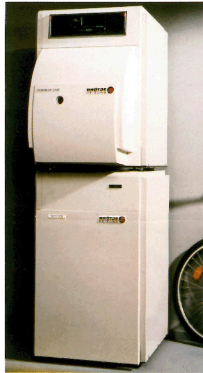
Moderne Ölheizung mit Warmwasserspeicher (Fabrikat Brötje)

Ölheizungen, die zwölf und mehr Jahre auf dem Buckel haben, funktionieren oft zwar noch einwandfrei, aber der Fortschritt hat sie überholt. Moderne Anlagen verbrauchen rund ein Drittel (!) weniger Heizöl, und ihr Schadstoffausstoß ist in der Regel nur halb so hoch. Außerdem wird die bevorstehende Verschärfung der Emissions-Grenzwerte vielen alten Heizungen endgültig den Garaus machen. Modernisierung ist also angesagt. Eine neue Brenner/Kessel-Kombination muß her.