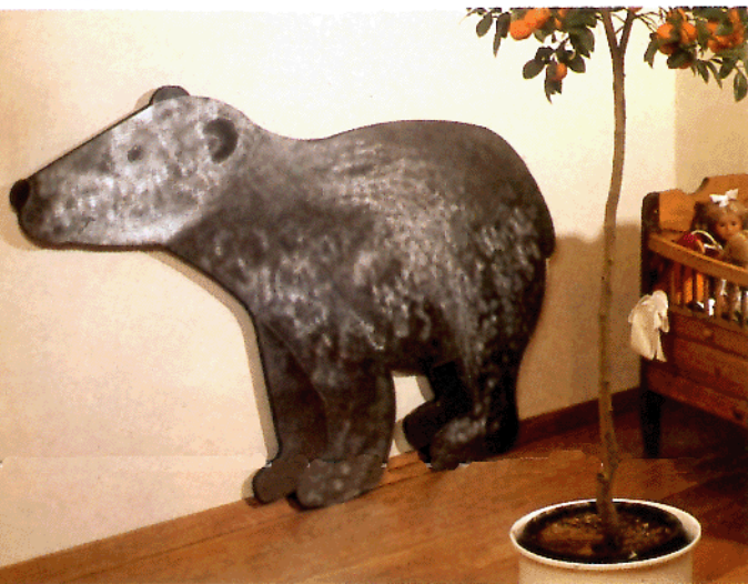
Modern und fröhlich: Ein Bär als Heizkörper fürs Kinderzimmer. Leider fast 3 000 Mark teuer.

ENGELKE ist darauf so gut vorbereitet wie nie zuvor. Das neue Betriebsgelände am Tempelhofer Weg (mit alter Telefonnummer!) liegt noch etwas näher am nächsten Großtanklager als der ehemalige Betriebshof, und die Tankfahrzeuge stehen jetzt über Nacht in einer geräumigen Halle. Sie können früh morgens pünktlich wie geplant starten. Keine Scheibe ist vereist, kein Domdeckel festgefroren. Das kommt Ihnen, unseren Kunden, zugute.